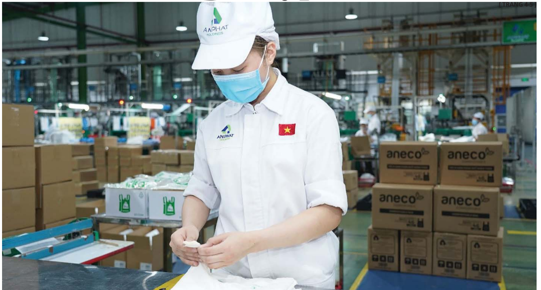
Thông tư 02/2023 của Ngân hàng Nhà nước tập trung tháo gỡ khó khăn về dòng tiền cho doanh nghiệp sản xuất. (Sản xuất bao bì tại Nhà máy An Phát.)